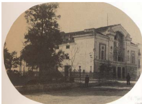
Teatro de Jumilla.

Archivo Histórico de Jumilla: Actas Capitulares, libro nº 18, años 1869-73.