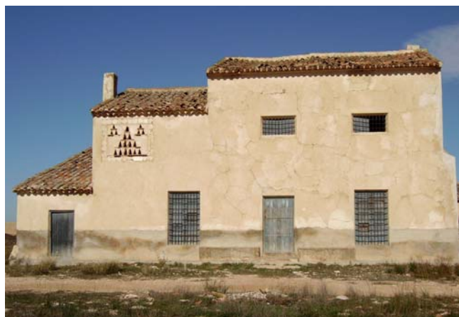
Cortijo Navazo Blanco, término M un pal. de Jumilla.